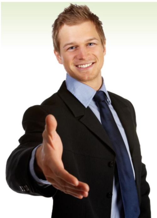
Фото / логотип компании/ ...