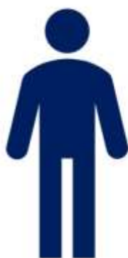
Представитель юридического лица