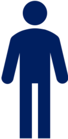
Представитель юридического лица

Вы можете не проводить у нас проверки. В нашей фирме все в порядке с пожарной безопасностью. Обещаю вознаграждение